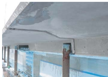
桁の添接板やパイプ等の保持金具等に干渉しないよう、ダクトルスラブに切欠き実施