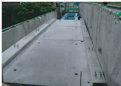
既設桁等の補修を実施後、ダクトルスラブ 6 枚敷設 (参考重量：2731kg/ 枚)