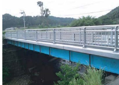
幅2600mm×厚さ320mm×長さ3120mm (歩道幅 2000mm、最少厚 60mm)