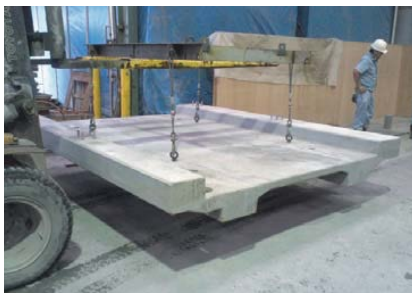
一時養生実施後に 90°C、48 時間の二次養生を実施