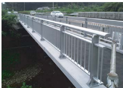
6 枚のダクトルスラブは、すべて形状が異なる