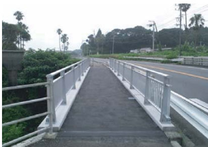
転落防止柵用のアンカーボルトを埋め込んで製造。ダクトルスラブ上にアスファルト舗装実施