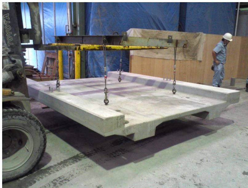
脱型直後のダクトスラブ（幅 2600mm×厚 320mm×長 3120mm。歩道幅 2000mm、最少厚 60mm） 6 ピース納入しました。